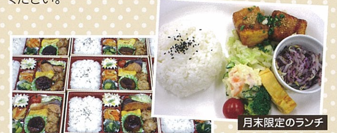
月末限定のランチ

宅配弁当も始めました。毎週火曜日・金曜日は松原病院売店にて販売、金曜日は提携先の石川県庁各課に配達しています。野菜がたくさん摂れると、好評です。また、焼き菓子、ケーキの受注販売も行っています。宅配弁当やお菓子は地域のイベントでの注文も随時承っており、公民館や地域の子供会、各種会議などで活用されています。少量からのご注文も承ります。お気軽にお問い合わせください。